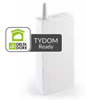
RF 6630 / RF 6640