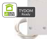
RF 660 FP ou RF 6600 FP Récepteur radio