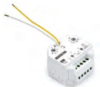
TYXIA 4811 ontvanger met gevoede uitgang