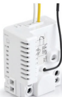
TYXIA 4600 Ontvanger met uitgang droog houdcontact