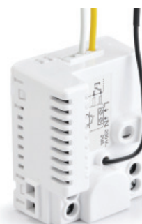
TYXIA 4620 Ontvanger met uitgang droog impulscontact