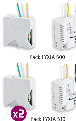
Pack TYXIA 500