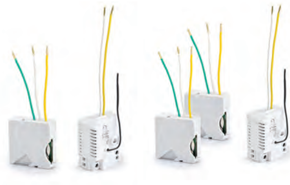
PACK TYXIA 500